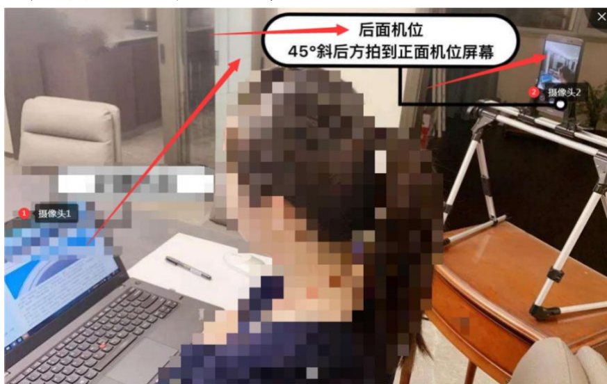
(双路摄像智慧监考形式)

1.非赛点院校：考生统一为线上非集中网络答题方式，可根据自身情况在封闭无他人的教室、宿舍、家中等处进行考试并按照考试要求进行线上智慧监考。